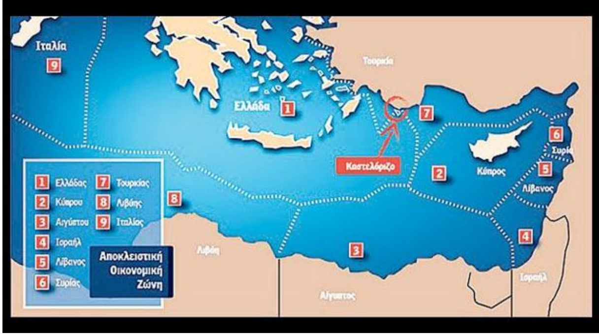
Şekil 2: Yunan Basınında Yer Alan MEB Bölgeleri